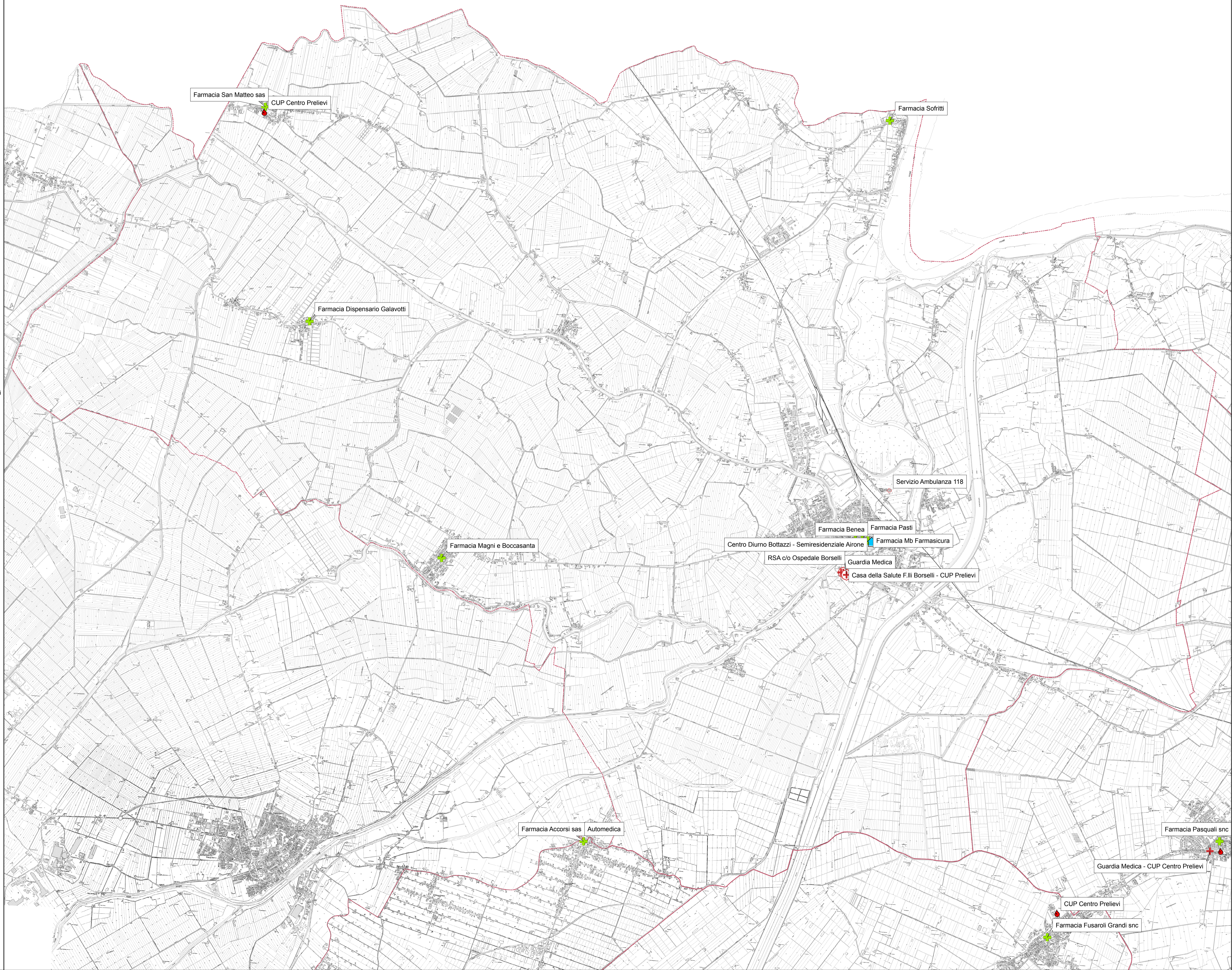
TAVOLA DELLE STRUTTURE SANITARIE